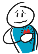
Latidos del corazón rápidos